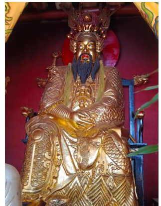
โดยเฉพาะชาวจีนในประเทศไทย

เช้า รับประทานอาหารเช้า ณ ห้องอาหารของโรงแรม (มื้อที่ 8) นำท่านเดินทางสู่ เมืองลูเฟิง (Lufeng) (ใช้เวลาเดินทาง 3 ชั่วโมง) นำท่านสู่ ศาลเจ้าพ่อเสือเหยิงบูชัว สร้างในสมัยราชวงศ์ซ่ง มีการบูรณะซ่อมแซมมากมาย จนกลายเป็นศาลเจ้าของศาสนาเต๋าที่ใหญ่โต มีผู้คนศรัทธามายูชาอยู่เสมอ ปัจจุบันเหยิงบูชัวได้ผสมผสานกับศาสนาพุทธให้เป็นหนึ่งเดียวกัน ให้ท่านได้นมัสการเจ้าพ่อเสือ ซึ่งถือเป็นองค์จริงที่ทางไทยได้จำลองมาสู่ศาลเจ้าพ่อเสือบริเวณเสาชิงช้า ชาวจีนแต่จิวถือว่าในชีวิตหนึ่งสำหรับนักธุรกิจจีนแล้ว จะต้องมานมัสการสักครั้งหนึ่ง ซึ่งคนส่วนใหญ่หลังจากนมัสการที่เหยิงบูชัวแล้ว กลับมาก็จะทำการค้าขึ้นประสบความสำเร็จในชีวิต ทุกๆปีจะมี ผู้ที่มานบนบานและแก้บน เดินทางมาจากภายในประเทศและต่างประเทศทุกสารทิศ ภายในวัดมีทั้งเทวรูปเจ้าแห่งภาคเหนือ ซึ่งเป็นเทวรูปที่รักษาดูแลเรื่องน้ำ ประดิษฐานปิดทองอยู่ในศาลเจ้า พร้อมกันนั้นก็ยังมีพระพุทธรูปประดิษฐานอยู่ในวิหารหน้า เป็นสถานที่สักการบูชาของคนซัวเถาอย่างกว้างขวาง และเป็นสถานที่ที่ชาวจีนโพ้นทะเล โดยเฉพาะชาวจีนในประเทศไทยจะนับถือกันมา