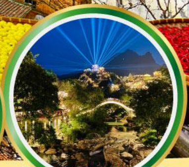
หุบเขาทวดา