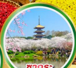
ชากระ ทะเลสาบตงหู