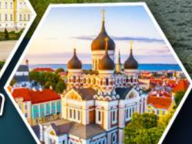
วิหารอเล็กซานเดอร์ เนฟสกี (ทาลลินน์)

• ล่องเรือซิลเลียไลน์ข้าม จากเอสโทเนียสู่ฟินแลนด์ • เข้าชมโบสถ์หิน Rock Church