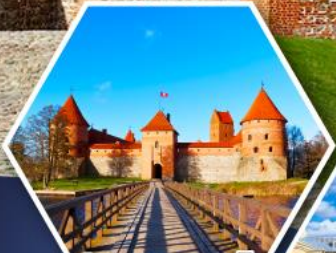
ปราสาททราไค