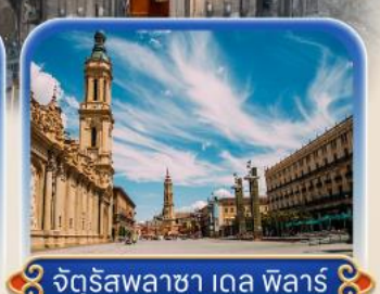
จัตุรัสพลาซ่า เดล ฟัลาร์