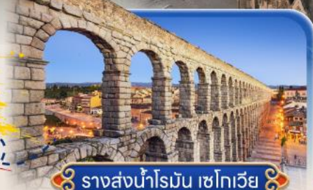
รางส่งน้ำโรมัน เซโกเวีย

สายการบินสัญชาติสเปน ✈️ บินตรง Full Service