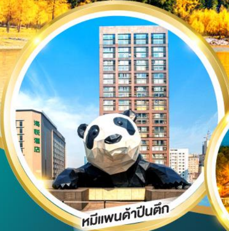
หมีแพนด้าป็นตึก