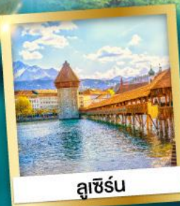
ลูซิิร์น