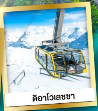
ดอลอไมท์