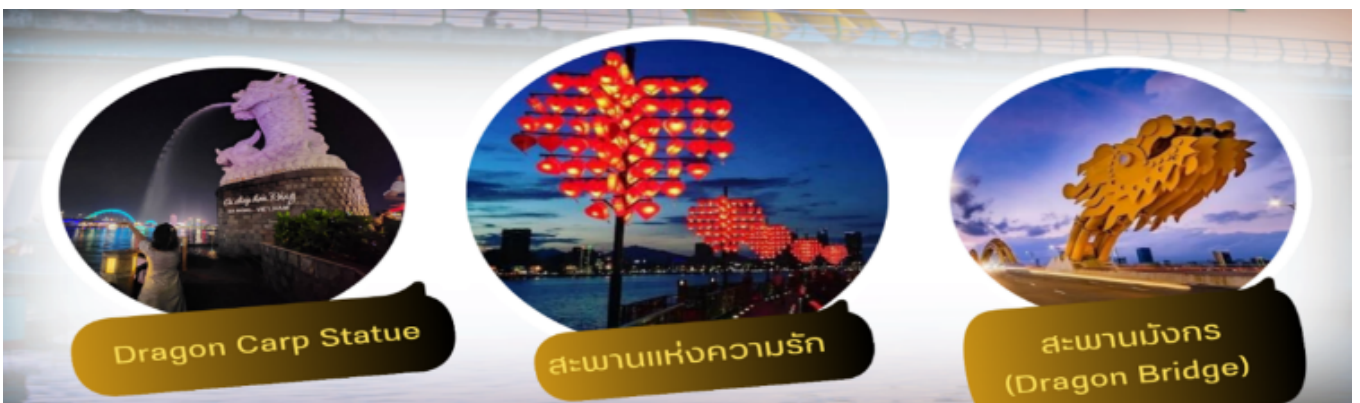
Dragon Carp Statue