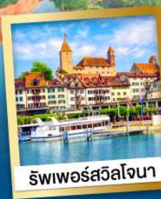
ริเวอร์สวิลโจนา