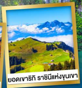
ยอดเขารัก ราชนิแห่งขุนเขา