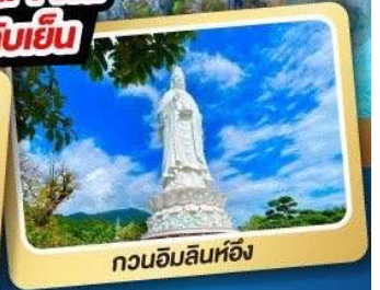
กวนอิมลินห์ฮิ่ง