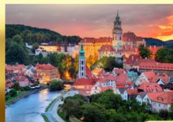
เชสกีครุมลอฟ