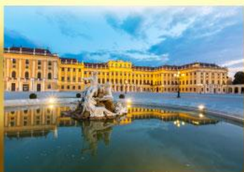
เข้าชมพระราชวังเชินบรุนน์