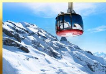
ขึ้นกระเช้าสู่ยอดเขากิตลิส