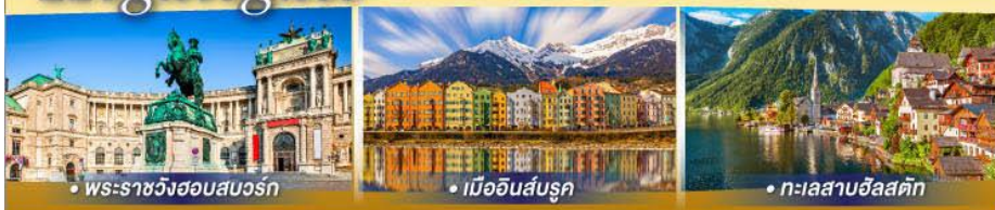
พระราชวังฮอสมบวร์ก