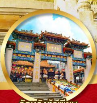
วัดหวังต้าเซียน