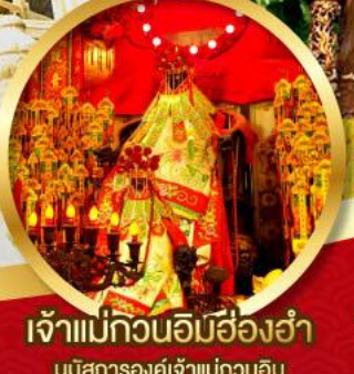
เจ้าแม่กวนอิมสี่องค์

นมัสการองค์เจ้าแม่กวนอิม อายุกว่า 600 ปี