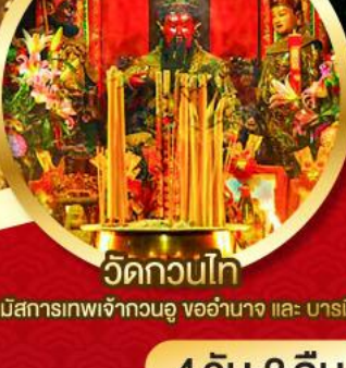
วัดกวนไท่

นมัสการองค์เจ้าแม่กวนอิม อายุกว่า 600 ปี