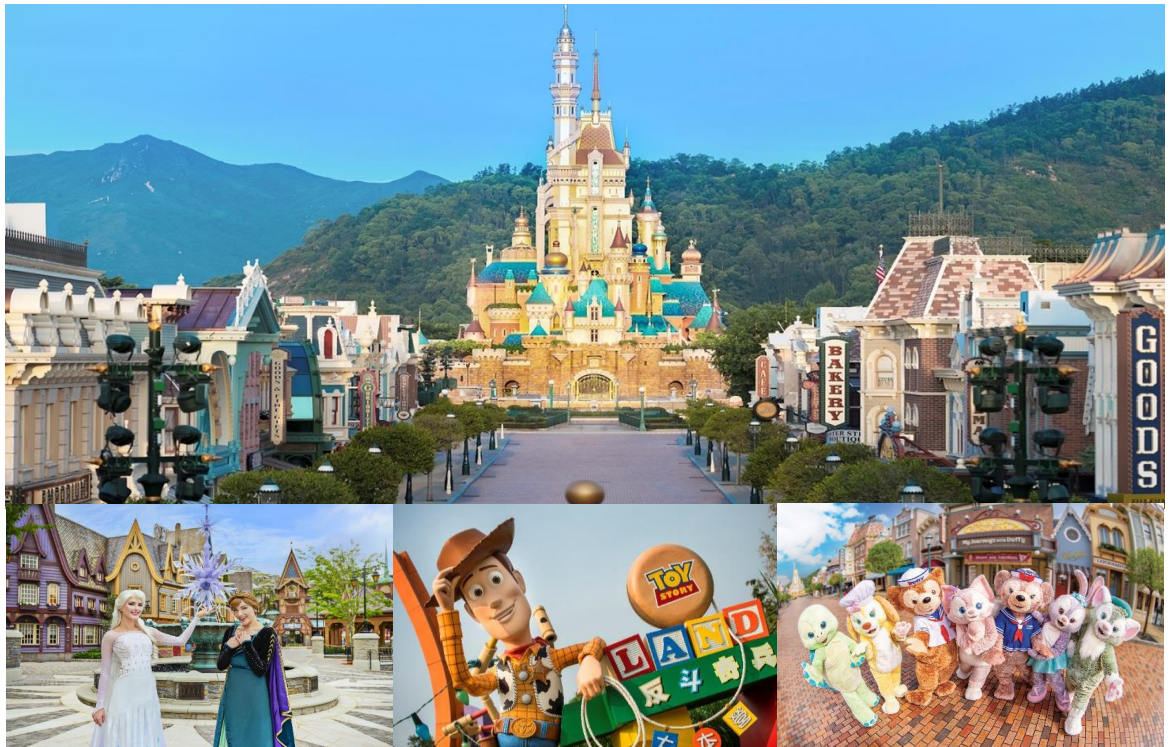
Option: Disneyland (ไม่รวมค่าเดินทาง)