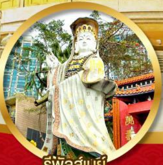
รีพลัสเบย์