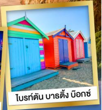
โบสถ์ดิน บาร์ตัง น็อกซ์