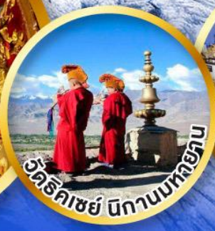
วัดริคเซย์ นิกานมทอยัน