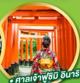
• ศาลเจ้าฟูชิมิ อินาริ