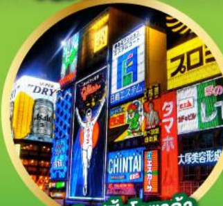
• ช้อปปิ้งโอซาก้า

• ชมความงามของกำแพงหิมะ เส้นทางสายอัลไพน์ทาเคยาม่า (Japan Alps Snow wall)