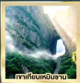
เขาคิเยนเหมินซาน