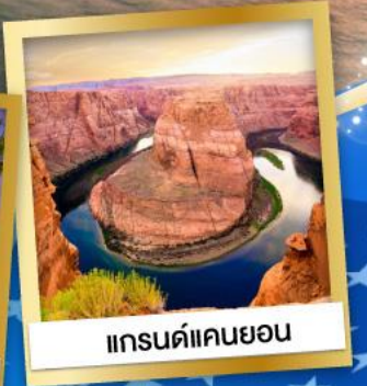
แกรนด์แคนยอน