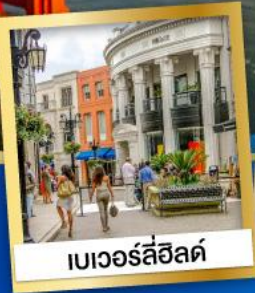
เบเวอร์ลี่ฮิลล์