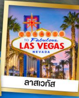
ลาสเวกัส